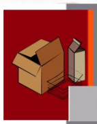
CARTA E CARTONE

Giocattoli, tappetini antiscivolo, guanti monouso, ceramica, porcellana, pannolini, assorbenti, sacchetti aspirapolvere, mozziconi sigaretta.